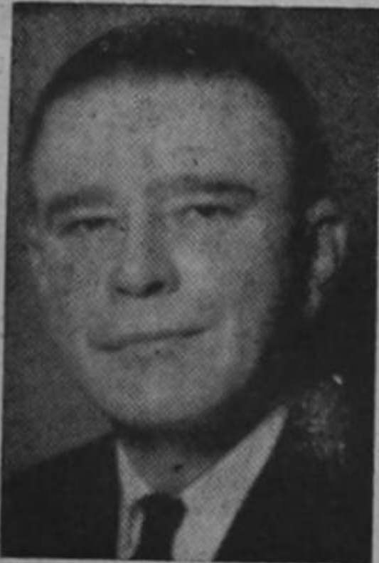
Funesto envenenador de conciencias