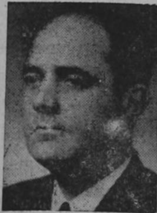
El puente para esta triste mascarada.