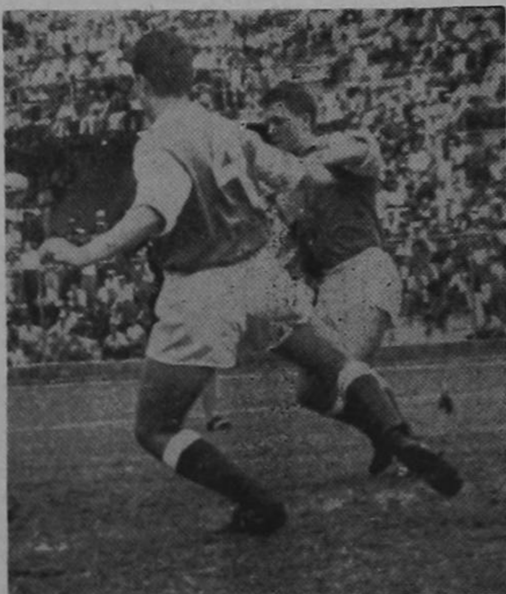
PANAMERICANO EL CLASICO DEL AÑO

Una vez que el Comité cuente con los fondos necesarios, comenzará la ampliación de las graderías del Estadio Nacional, que se considera el paso más importante en esta labor preliminar. De acuerdo con los estudios llevados a cabo por ingenieros de Obras Públicas, se construirá la gradería del oeste, a fin de darle al Estadio Nacional una capacidad aproximada a las cincuenta mil personas. Se considera que el paso más importante es dar al público facilidades para que pueda ver los partidos con comodidad.