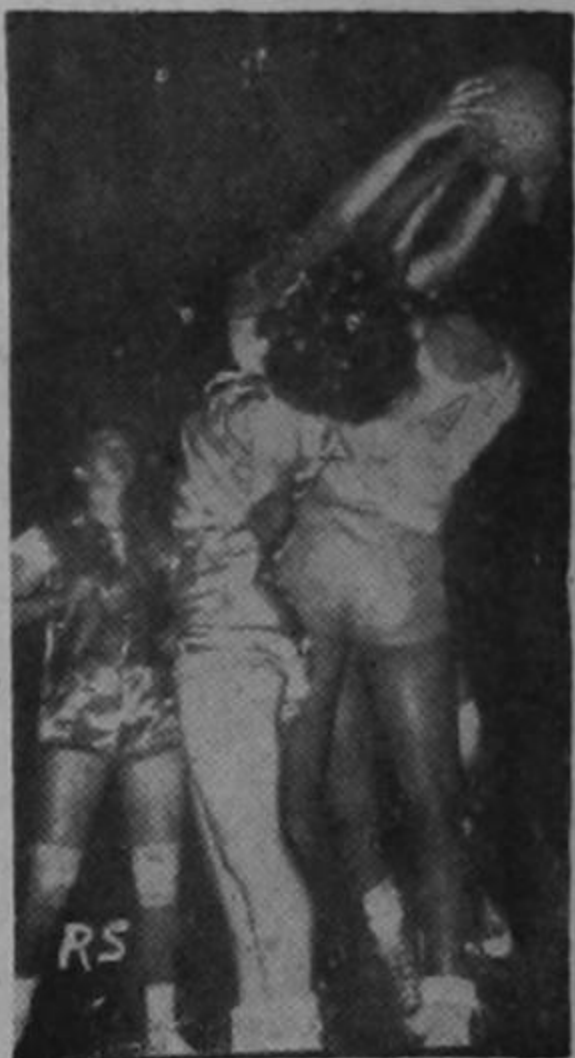
Cobra vida el baloncesto

DESODORANTES D-Ten REGULA LA TRANSPIRACION DE LAS AXILAS Y LAS DESODORIZA POR VARIOS DIAS