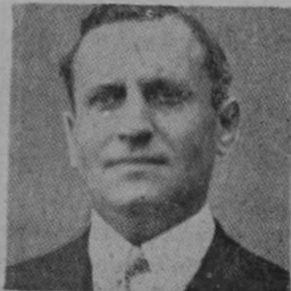
Su venganza será como su exilio.