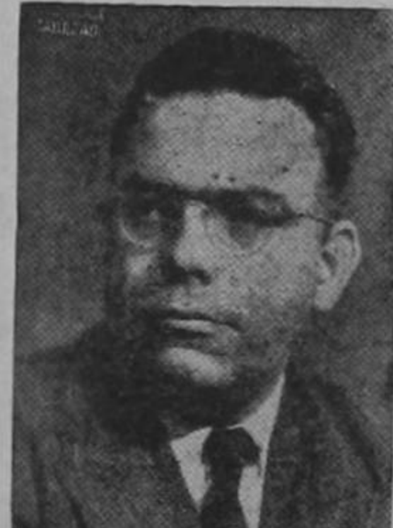
El santo que hierre por la espalda.

Ulate el hombre más ruin y despiadado de la historia política de Costa Rica, se presenta una vez más mendigando a los costarricenses que crean en su piel de oveja negra