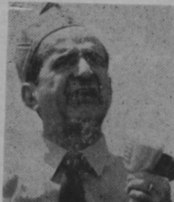
El látigo que enluta hogares.