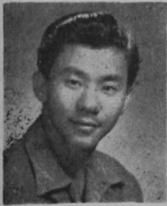
Adolfo Chin, Campeón Nacional de Tennis de Mesa